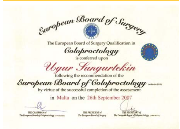
Resim 3. Sınav sonu verilen diploma.